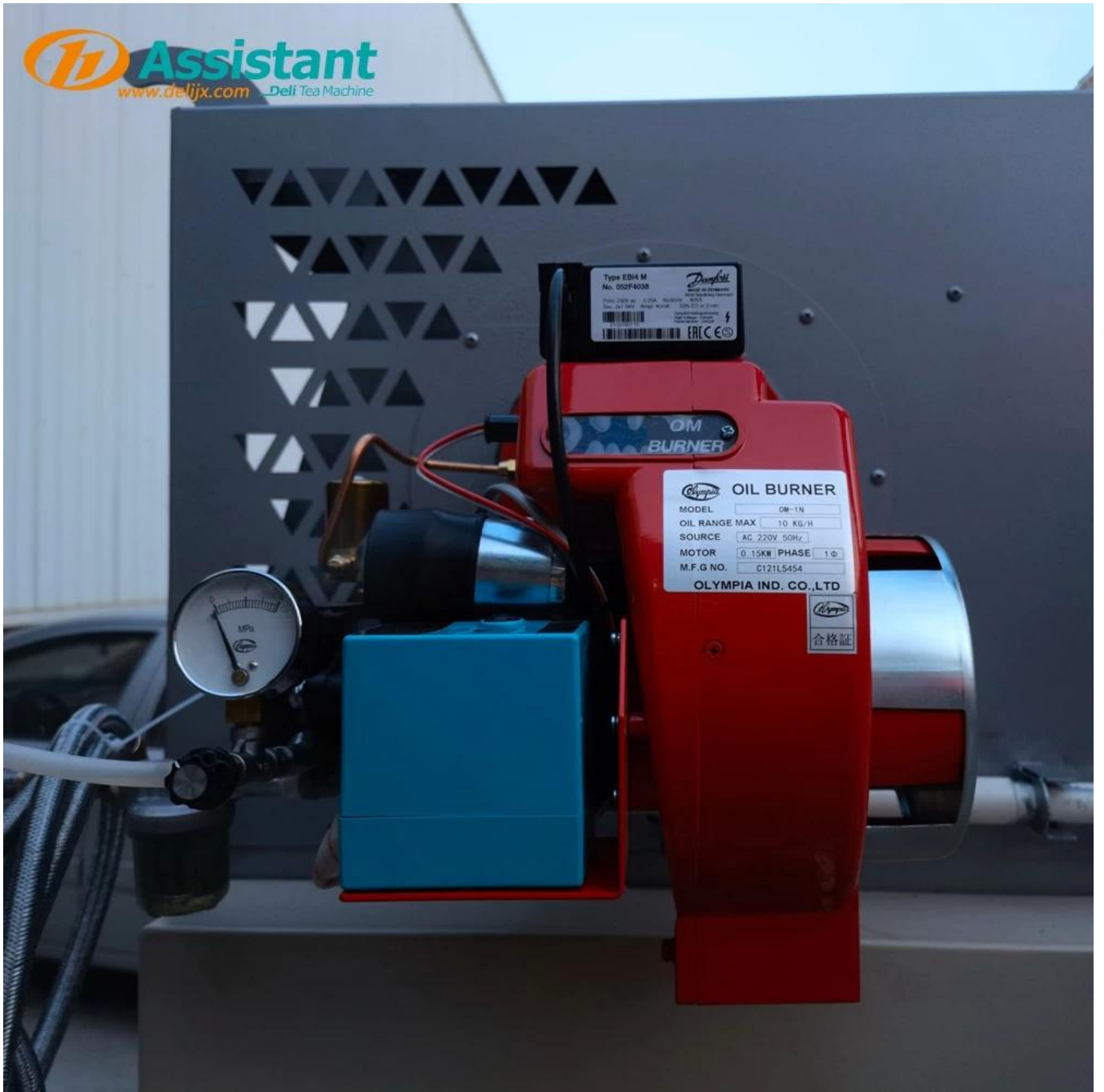
Pembakar Olympia asli Jepang.