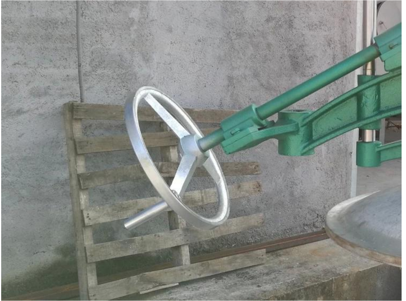
Desain handwheel yang diperbesar, pengangkatan penutup laras lebih cepat.