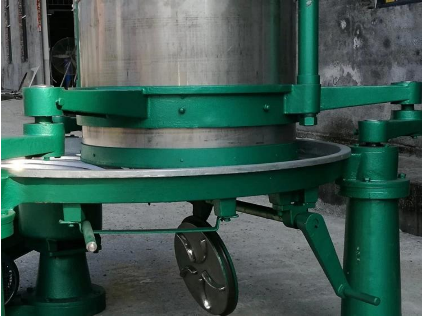
Bagian pendukung mesin terbuat dari besi cor, yang kuat dan tahan lama.