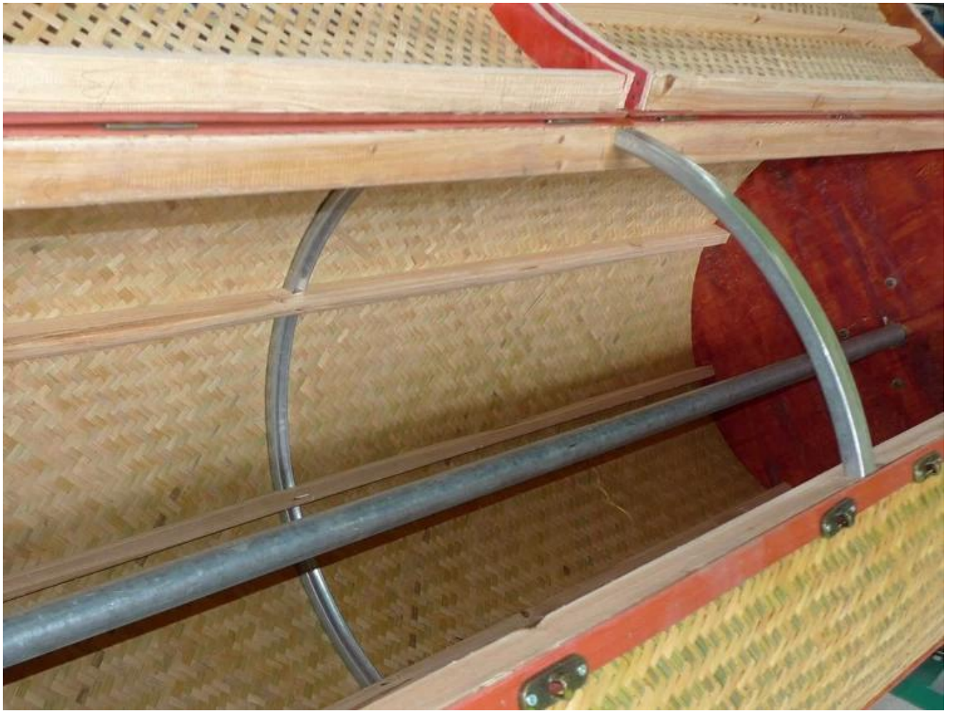
Tabung baja dan desain tulangan cincin baja, mesin berjalan lancar, dan getaran bodi kecil.