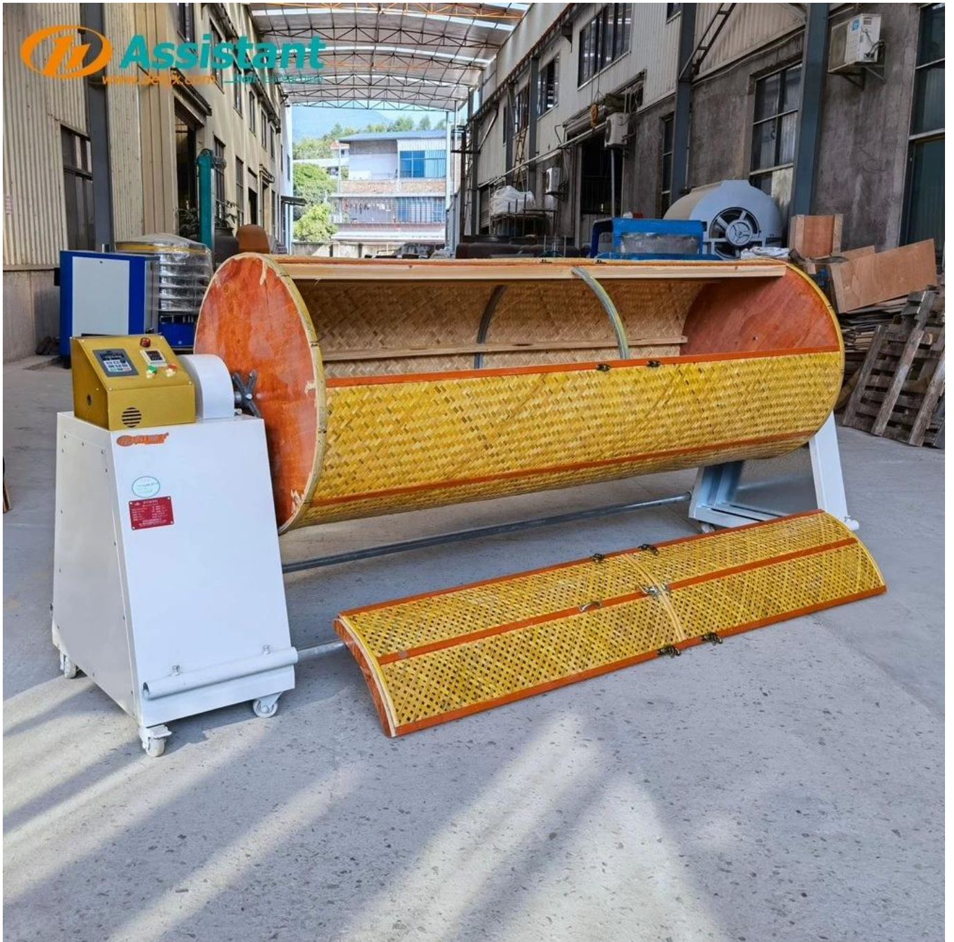
Tabung baja dan desain tulangan cincin baja, mesin berjalan lancar, dan getaran bodi kecil.