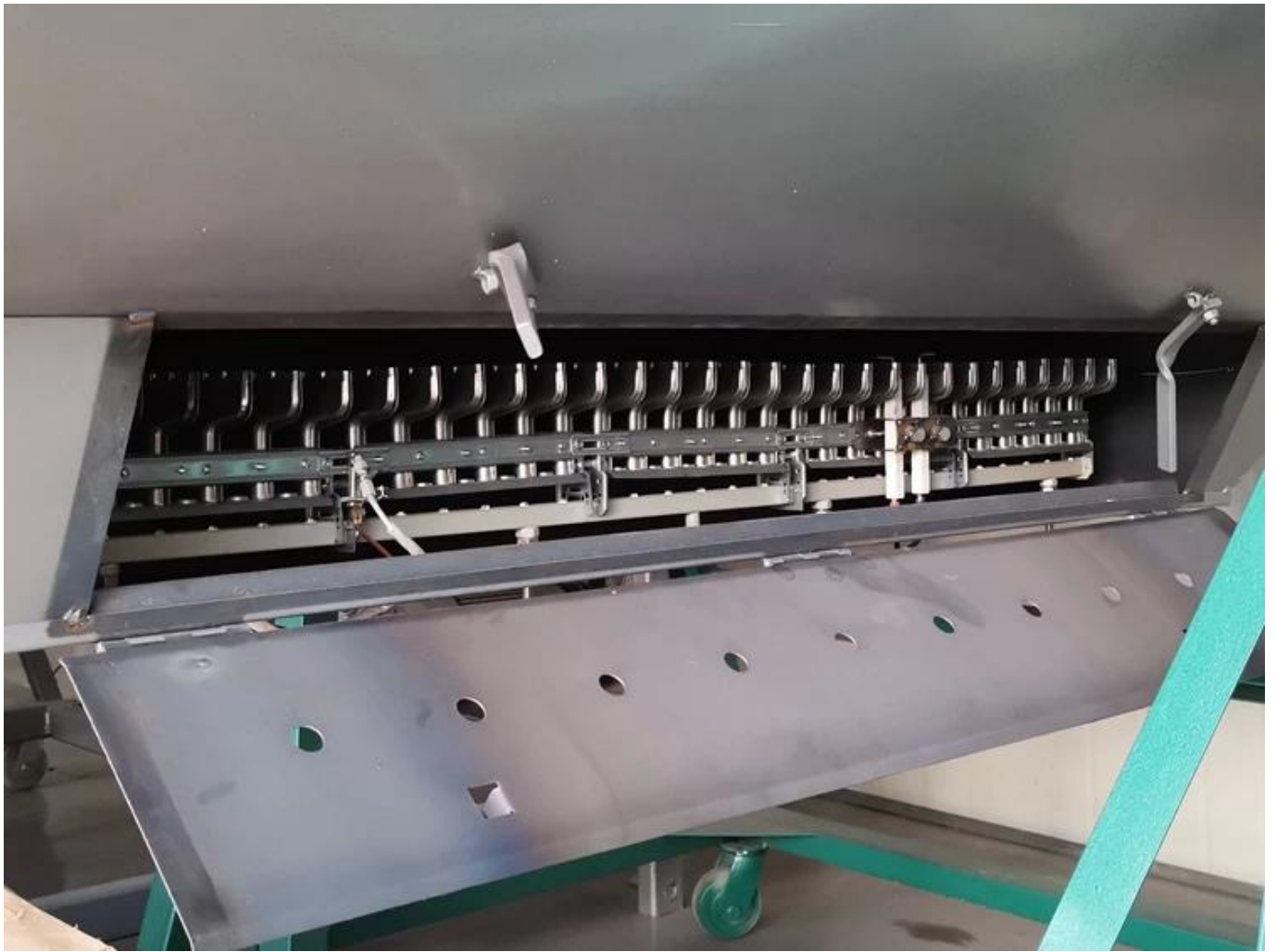
Peleton api pembakaran berbentuk T yang menutupi tong fiksasi teh, area pembakaran hingga 100%.